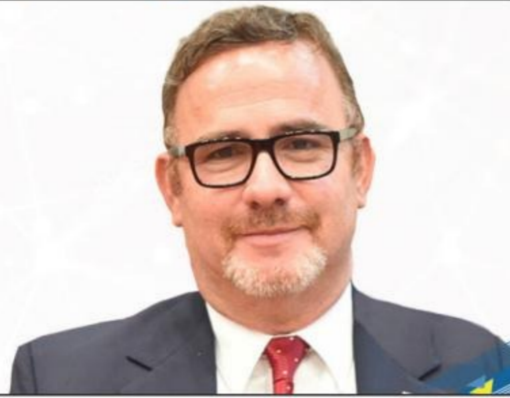
MINISTER GLENBERT F. CROES